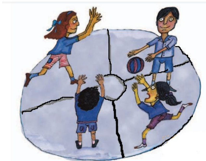
Imagen adaptada de Educación Física Sexto grado (p 43), por I. Huesca 2010. Secretaría de Educación.