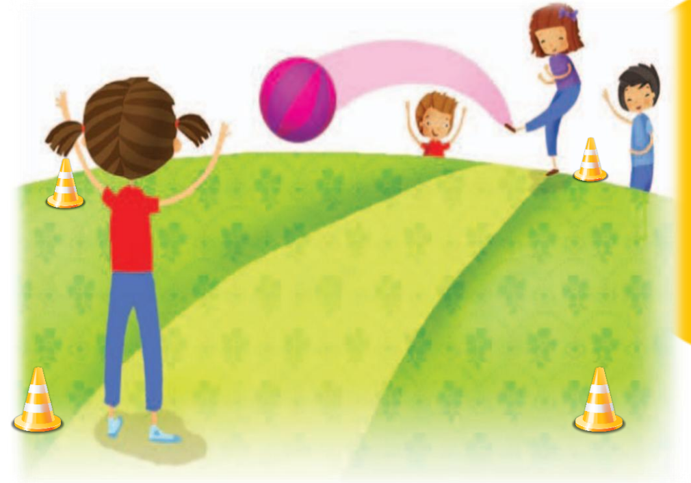
Imagen adaptada de Educación Física Segundo grado (p. 38) J , Platas 2010, Secretaría de Educación Pública.