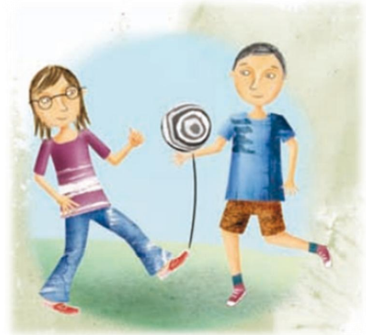
Imagen adaptada de Educación Física Sexto grado (p 84), por I. Huesca 2010. Secretaría de Educación.