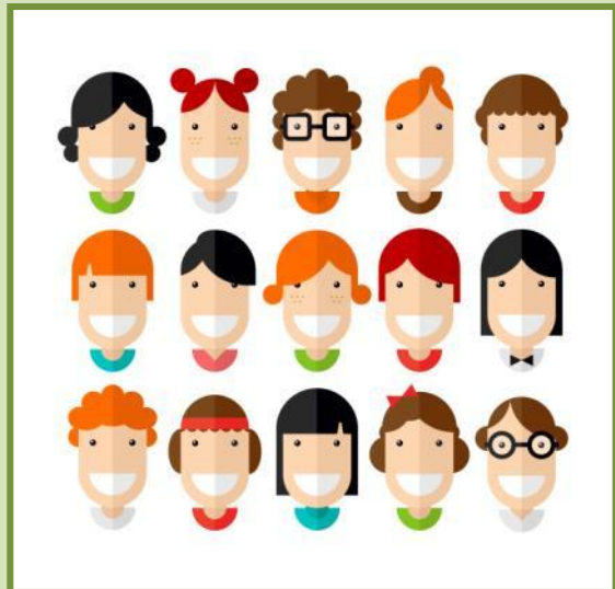
NO CRITICAR A LOS DEMÁS POR SU ASPECTO FÍSICO