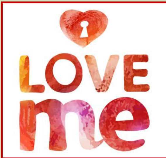
ME GUSTA MI CUERPO AUTOESTIMA