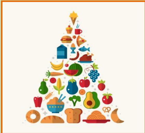
COMER SANO DIETA EQUILIBRADA