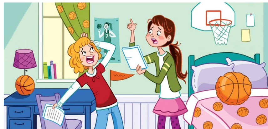
Imagen 4. Alusiva a la sesión.

Colección de Nuevas láminas Desarrollo de la Expresión Oral – Pragmática (orientacionandujar.es)