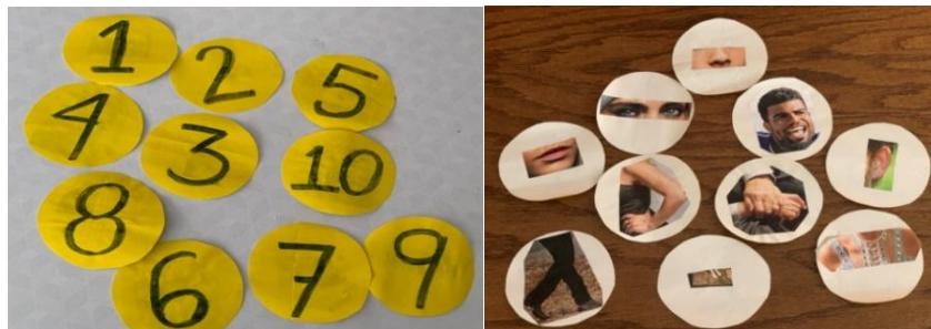
Imagen 2 y 3. Nota: Imagen adaptada, muestran unas fichas, en un lado de la cara partes del cuerpo y expresión de emociones, en el otro lado números del 1 al 10. Elaboración propia Barrón, T. 2021

Espacio libre de obstáculos que representen riesgos (cuidar que el piso no sea resbaloso).