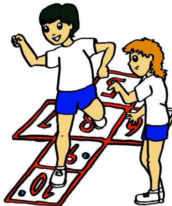
Imagen 1. Alusiva a la sesión. rayuela.jpg (427x500) ( bp.blogspot.com )

Que el alumno coordine sus movimientos globales y segmentarios, mediante juegos tradicionales, que fortalezcan el conocimiento motriz de sí mismo y de sus emociones.