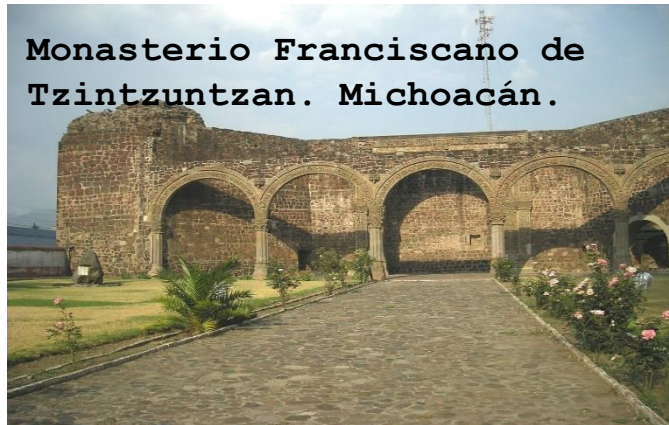
Monasterio Franciscano de Tzintzuntzan. Michoacán.

Estas fotos de Autor desconocido están bajo licencia CC BY-SA