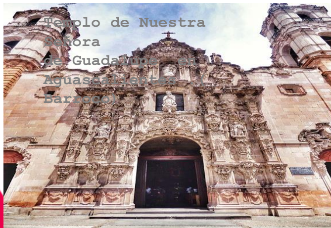
Templo de Nuestra Señora de Guadalupe en Aguascalientes.