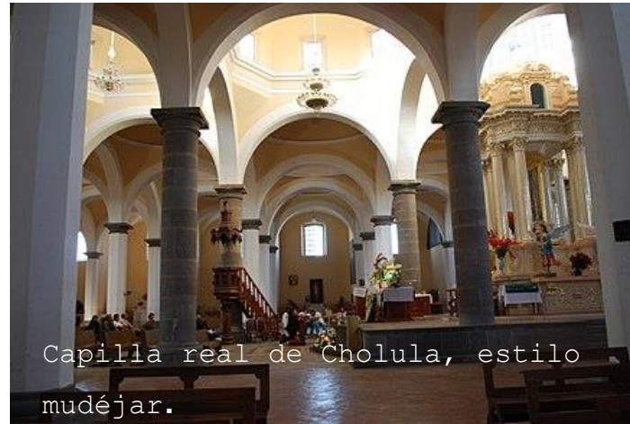
Capilla real de Cholula, estilo mudéjar.