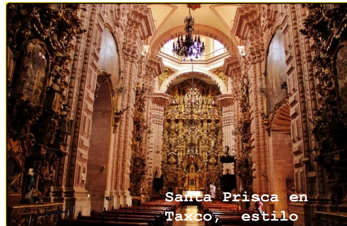
Santa Prisca en Taxco, estilo barroco.