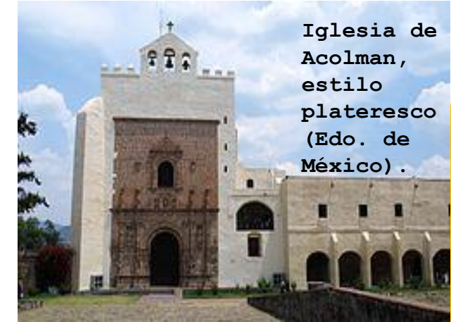
Iglesia de Acolman, estilo plateresco (Edo. de México).