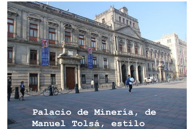
Palacio de Minería, de Manuel Tolsá, estilo neoclásico.