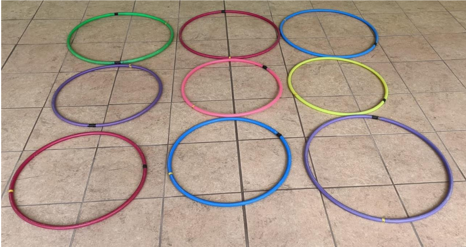
Fotografía 5. Nota: Twister . Hidalgo P. 2022