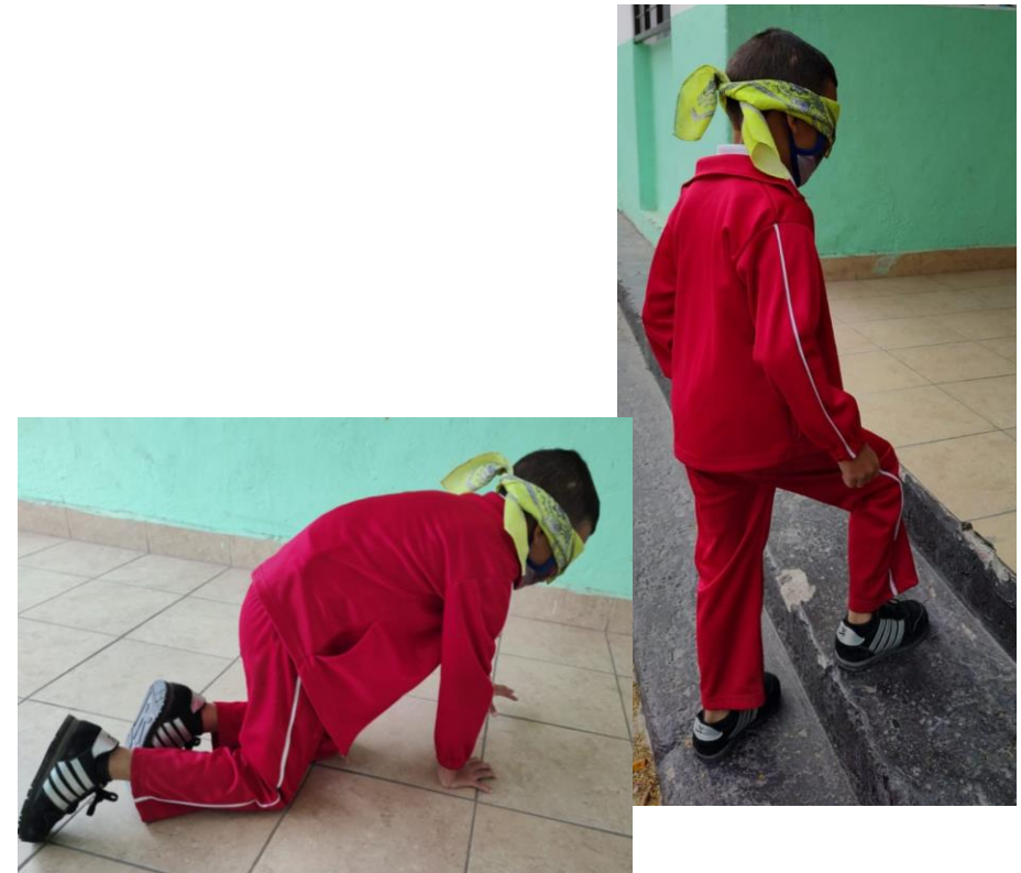
Fotografía 2. Nota: Soy tu guía. Dávila M.2022