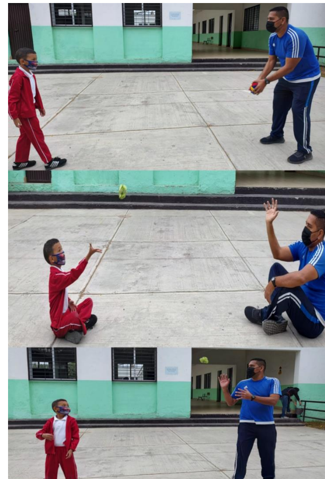
Fotografía 4. Nota: Coordinando acciones . Dávila M. 2022