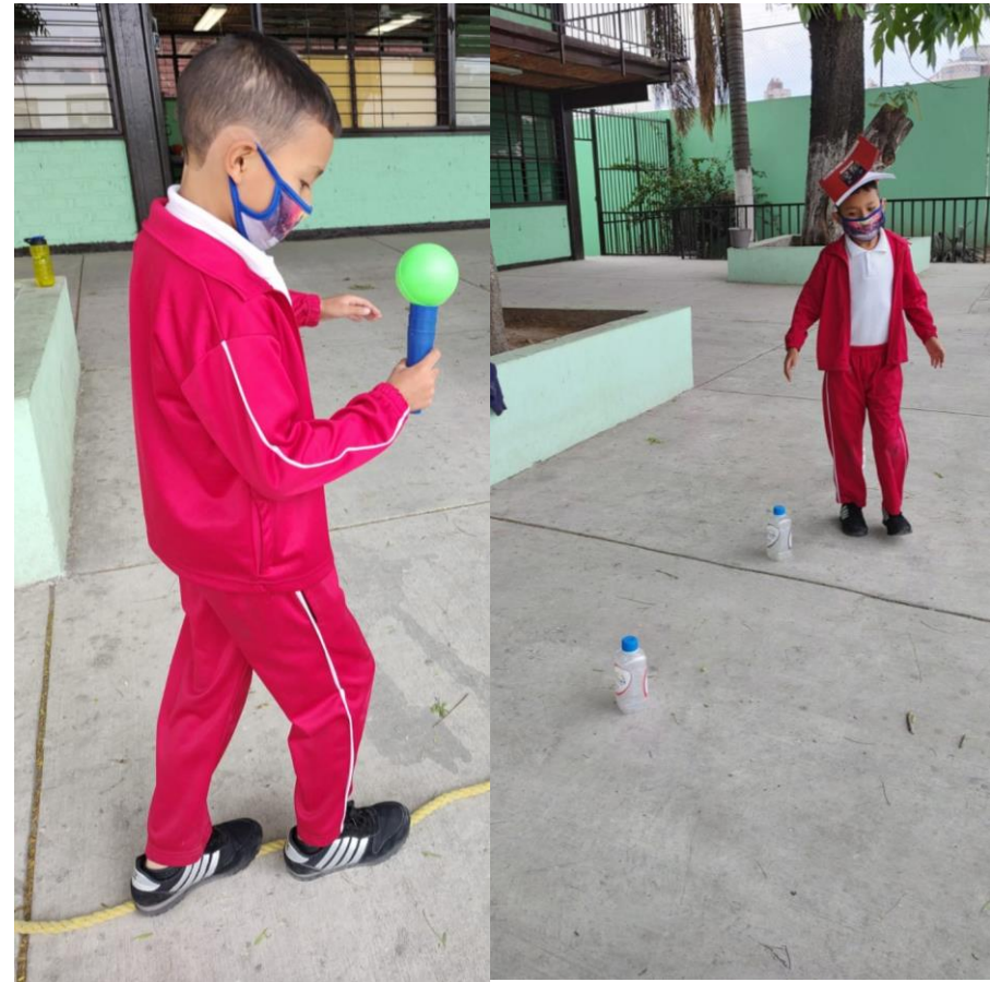
Fotografía 3. Nota: Los equilibristas. Manzo P. 2022