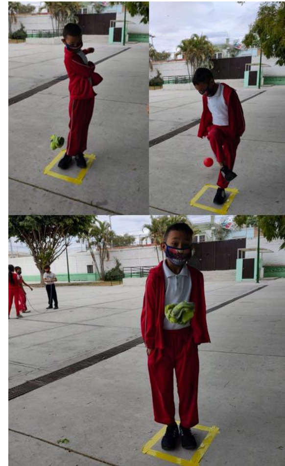
Fotografía 4. Nota: Cuadro quemado . Hidalgo P. 2022