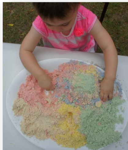
Jugar con arena mágica