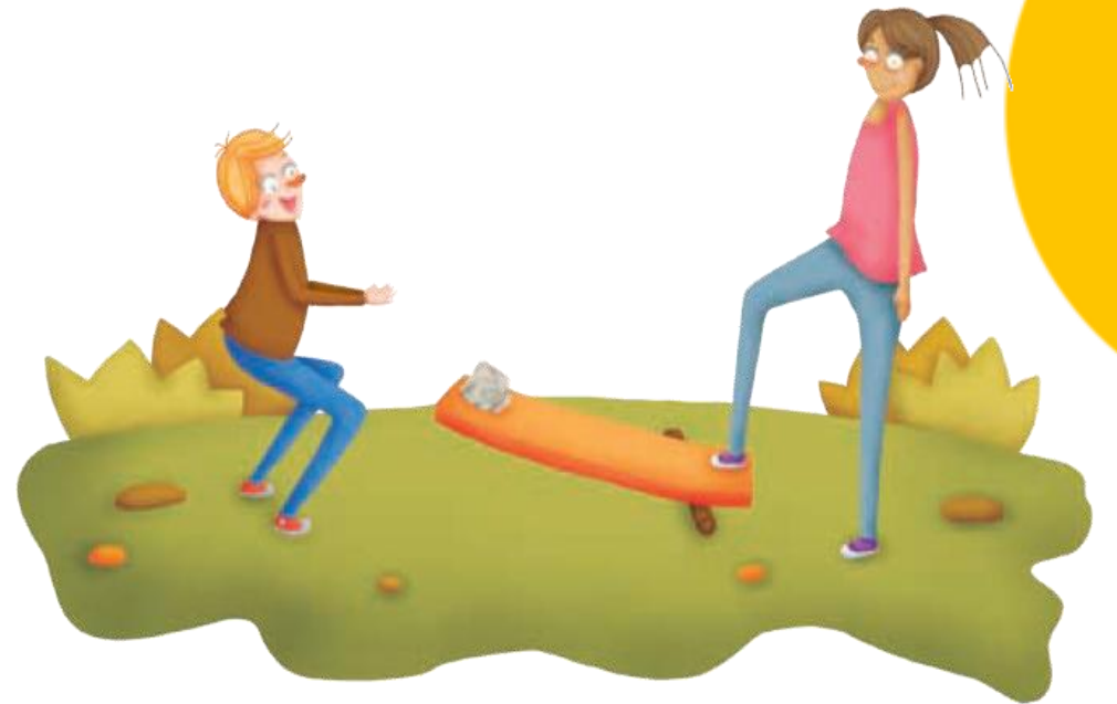
Imagen 1. adaptada de Educación Física Quinto grado (p. 15.) Esmeralda Ríos 2010, Secretaria de Educación Pública.