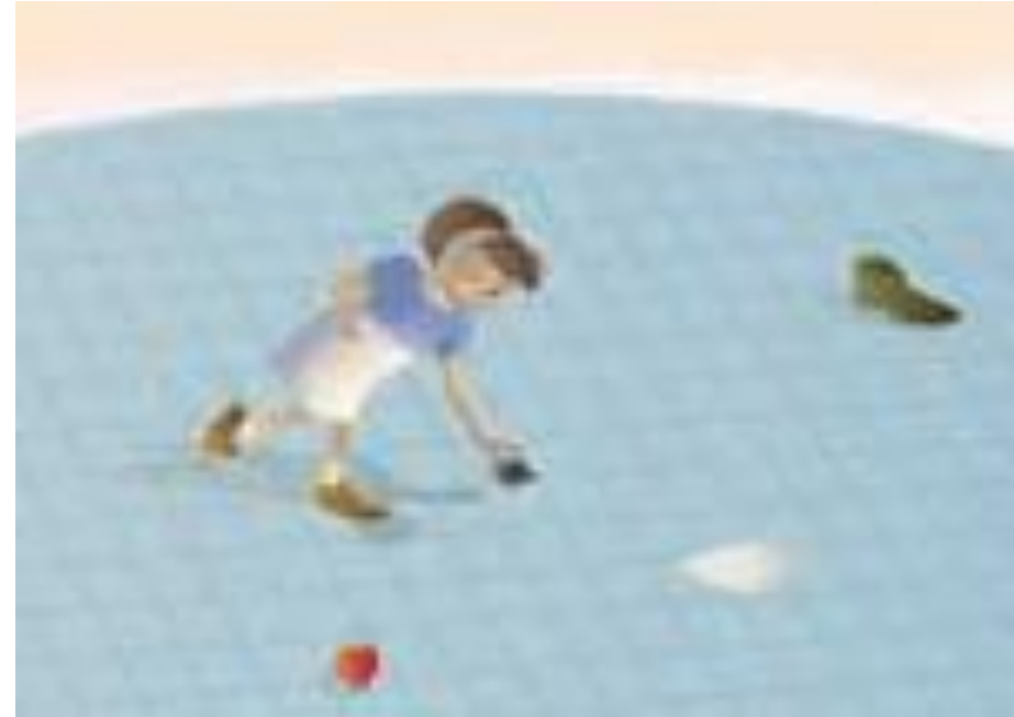
Imagen 4. adaptada de Educación Física Cuarto grado (p. 74,) Enrique Torralba 2010, Secretaria de Educación Pública.