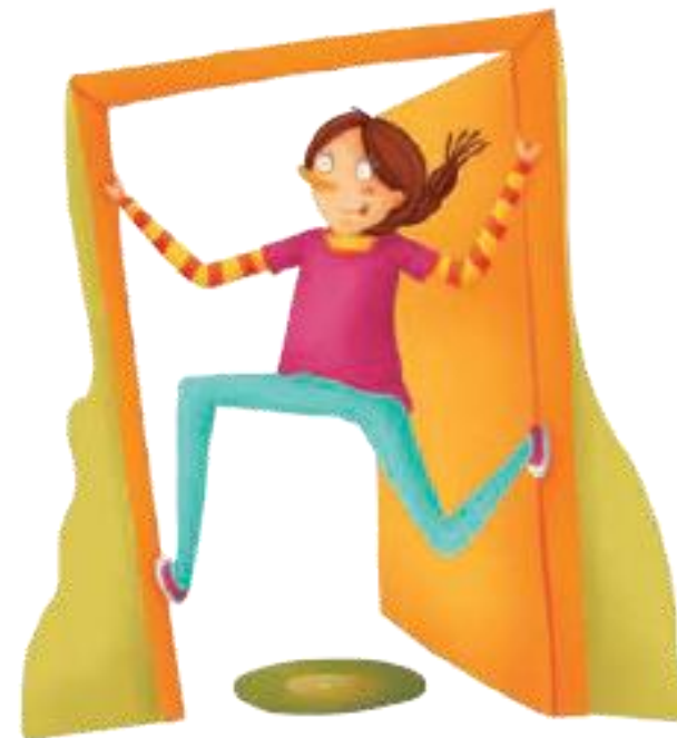
Imagen 5. adaptada de Educación Física Quinto grado (p. 20.) Esmeralda Ríos 2010, Secretaria de Educación Pública.