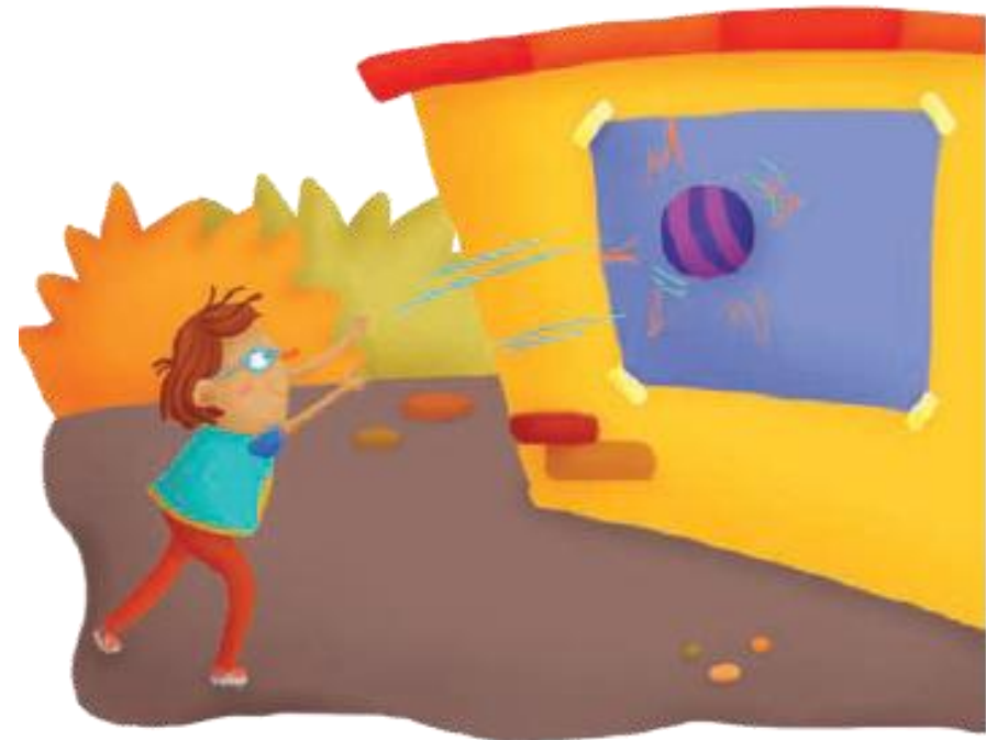
Imagen 3. adaptada de Educación Física Quinto grado (p. 24) Nurivan Vilorio 2010, Secretaria de Educación Pública.