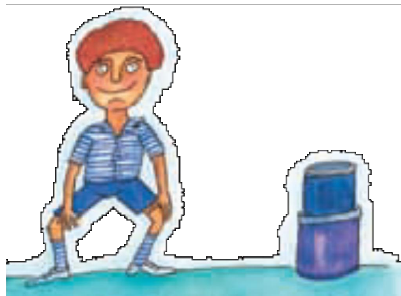
Imagen 5. adaptada de Educación Física Sexto grado (p. 40) Erika Martínez 2010, Secretaria de Educación Pública.

En esta sesión pondrás en juego tus habilidades motrices y conocerás como utilizas la sincronización en tus movimientos.