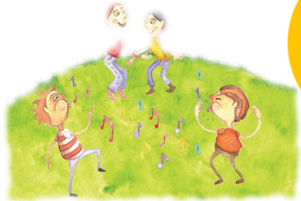
Imagen 4. adaptada de Educación Física Quinto grado (p. 40) Nurivan Vilorio 2010, Secretaria de Educación Pública.