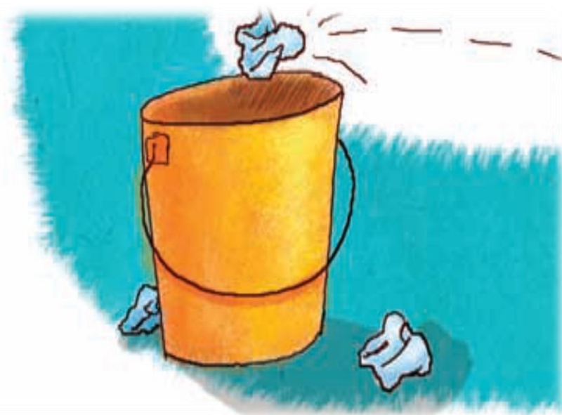
Imagen 2. adaptada de Educación Física Quinto grado (p. 13,) Margarita Sada 2010, Secretaria de Educación Pública.