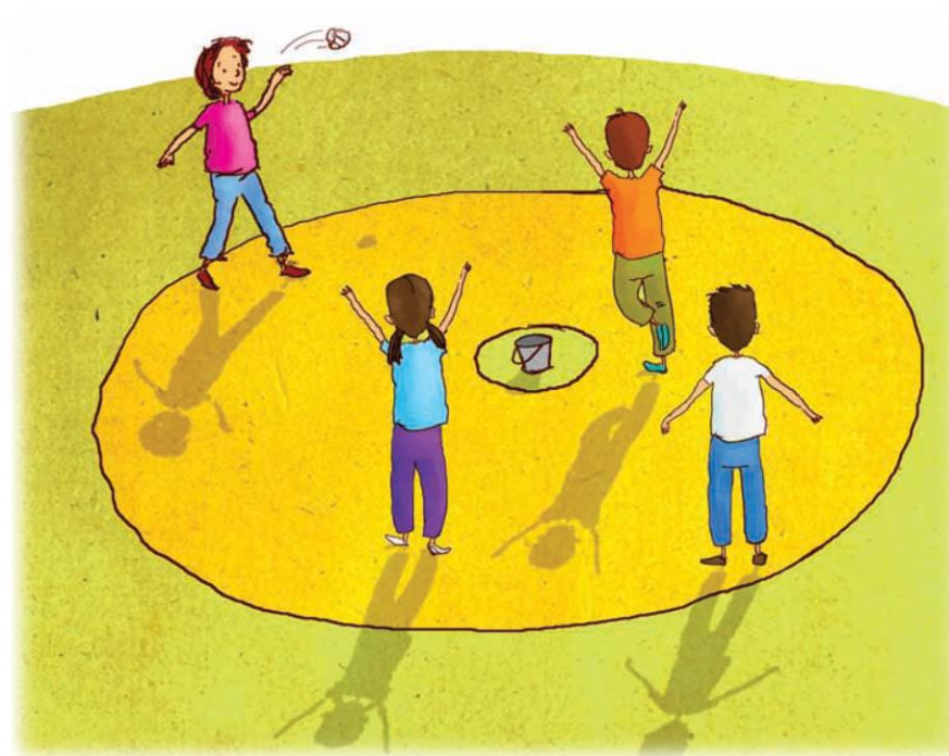
Imagen 6. adaptada de Educación Física Quinto grado (p. 88) Margarita Sada 2010, Secretaria de Educación Pública.