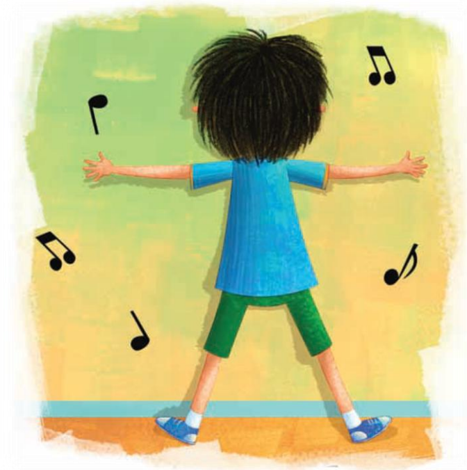
Imagen 1. adaptada de Educación Física Quinto grado (p. 13,) Nurivan Viloría 2010, Secretaria de Educación Pública.

En esta sesión reconocerás tus potencialidades, tu ritmo y tu capacidad de reacción, que emplearás para superar los retos que se presentan en el juego.