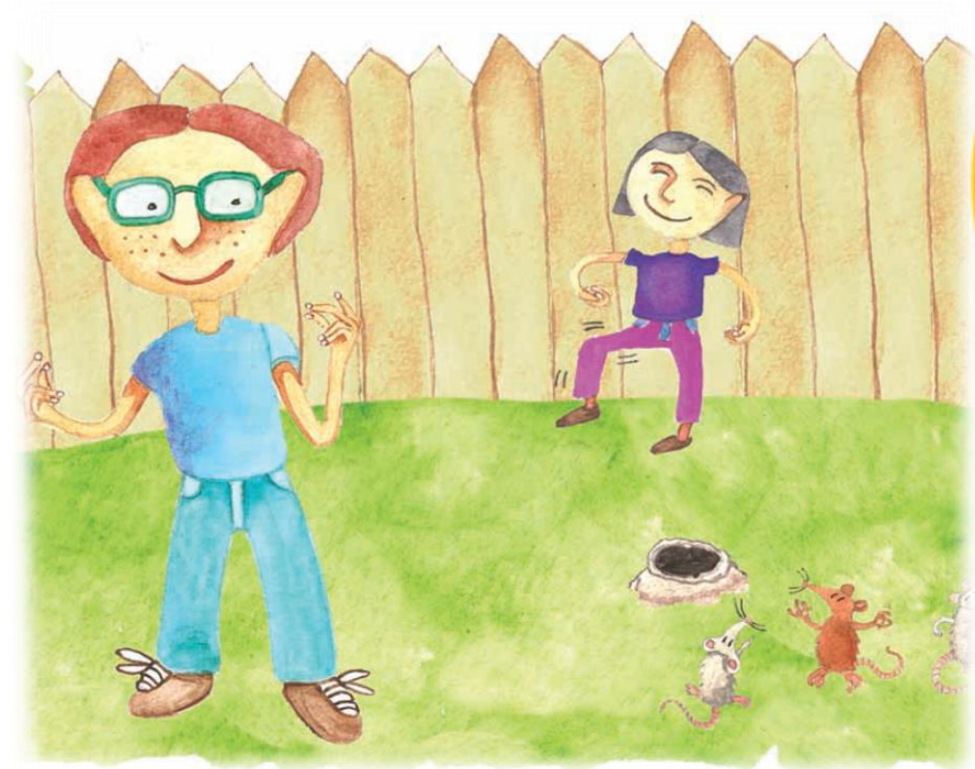
Imagen 3. adaptada de Educación Física Quinto grado (p. 38) Nurivan Vilorio 2010, Secretaria de Educación Pública.

En esta sesión utilizarás tu cuerpo para crear secuencias rítmicas e incorporar tus posibilidades expresivas.