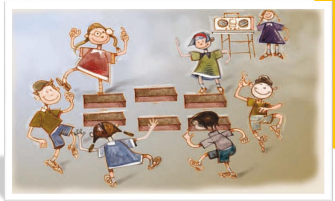
Imagen adaptada de Educación Física. Cuarto grado (p. 66), por Vélez, V., 2010, Secretaría de Educación Pública