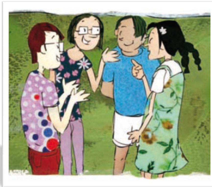
Imagen adaptada de Educación Física. Cuarto grado (p. 46), por Molina, D. 2010, Secretaría de Educación Pública.