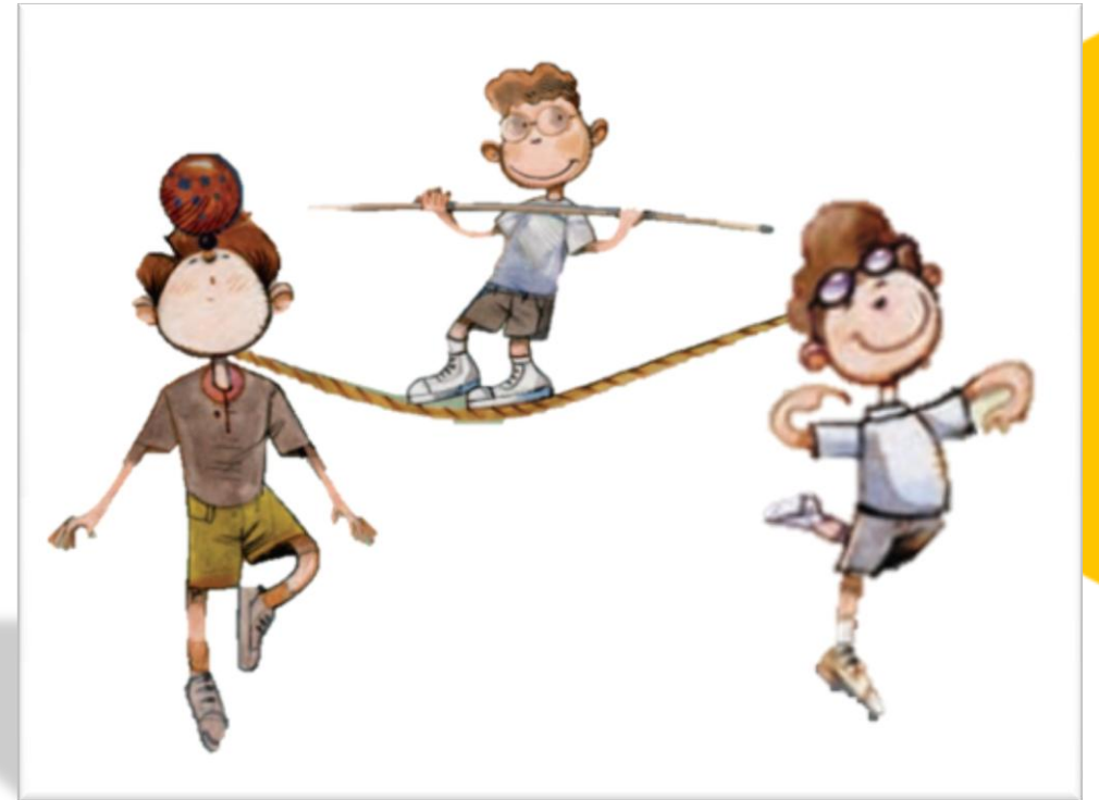
Imagen adaptada de Educación Física. Cuarto grado (pp. 50,54), por Vélez, V. 2010, Secretaría de Educación Pública.