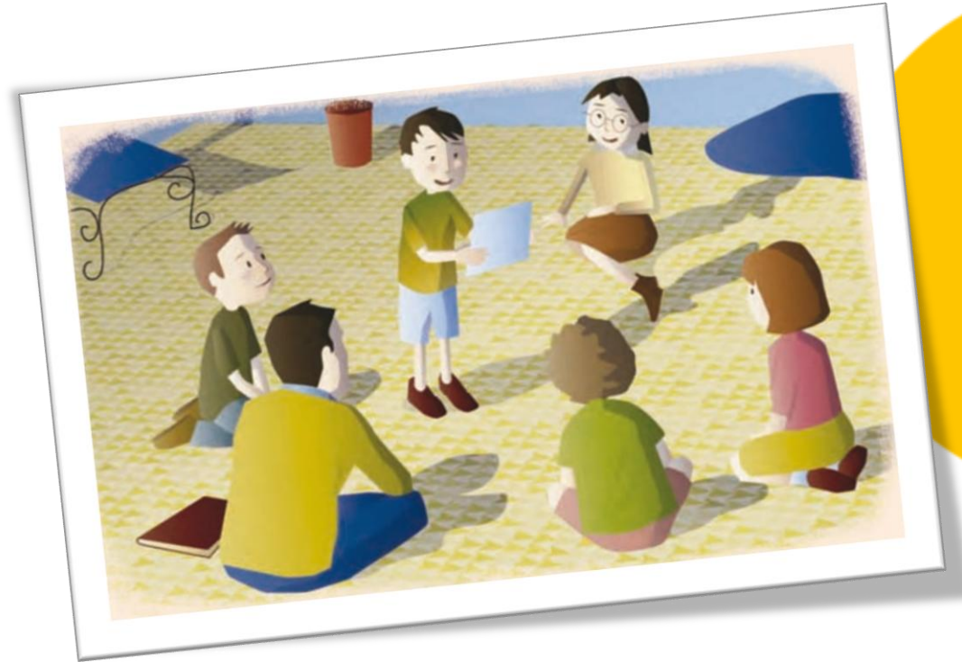
Imagen adaptada de Educación Física. Cuarto grado (p. 84), por Torralba, E. 2010, Secretaría de Educación Pública.