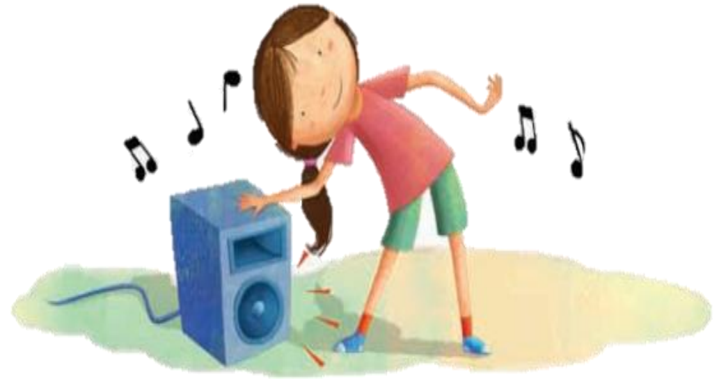
Imagen 1. Adaptada de Educación Física Quinto grado (p38.) por González, C. Huesca, Israel. (2011) Secretaría de Educación Pública.

Qué el alumno logre reaccionar corporalmente ante un estímulo auditivo, a la vez que representa una situación a partir de una consigna.