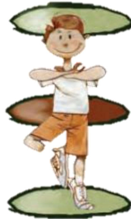
Imagen 2. Adaptada de Educación Física Cuarto grado (p53.) por González, C. Huesca, Israel. (2011) Secretaría de Educación Pública.

Que el alumno identifique los códigos de comunicación establecidos en el juego, por ejemplo: que al adoptar una postura estática es salvado, mientras así permanezca.