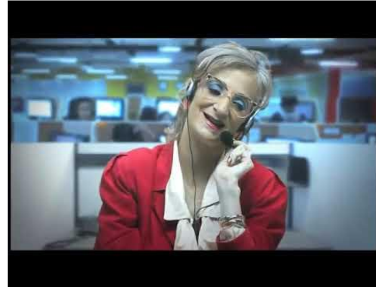
Canal Revés (18 noviembre 2020) Publicidad Engañosa , 4:13 minutos

¿Qué opinas del contenido de los videos?, ¿cómo se relacionan con el video que viste al inicio de la ficha?, ¿a qué conclusiones llegas?