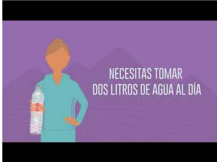
Canal Cacto Producciones, (04 marzo 2019) Publicidad y hábitos , 1:10 minutos