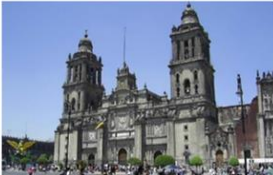
Catedral de México