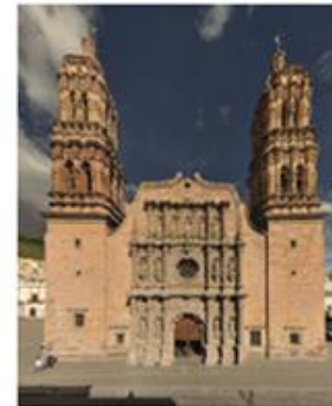
Catedral de Zacatecas

fuentes: http://www.gantousarquitectos.com/proyecto/25#1