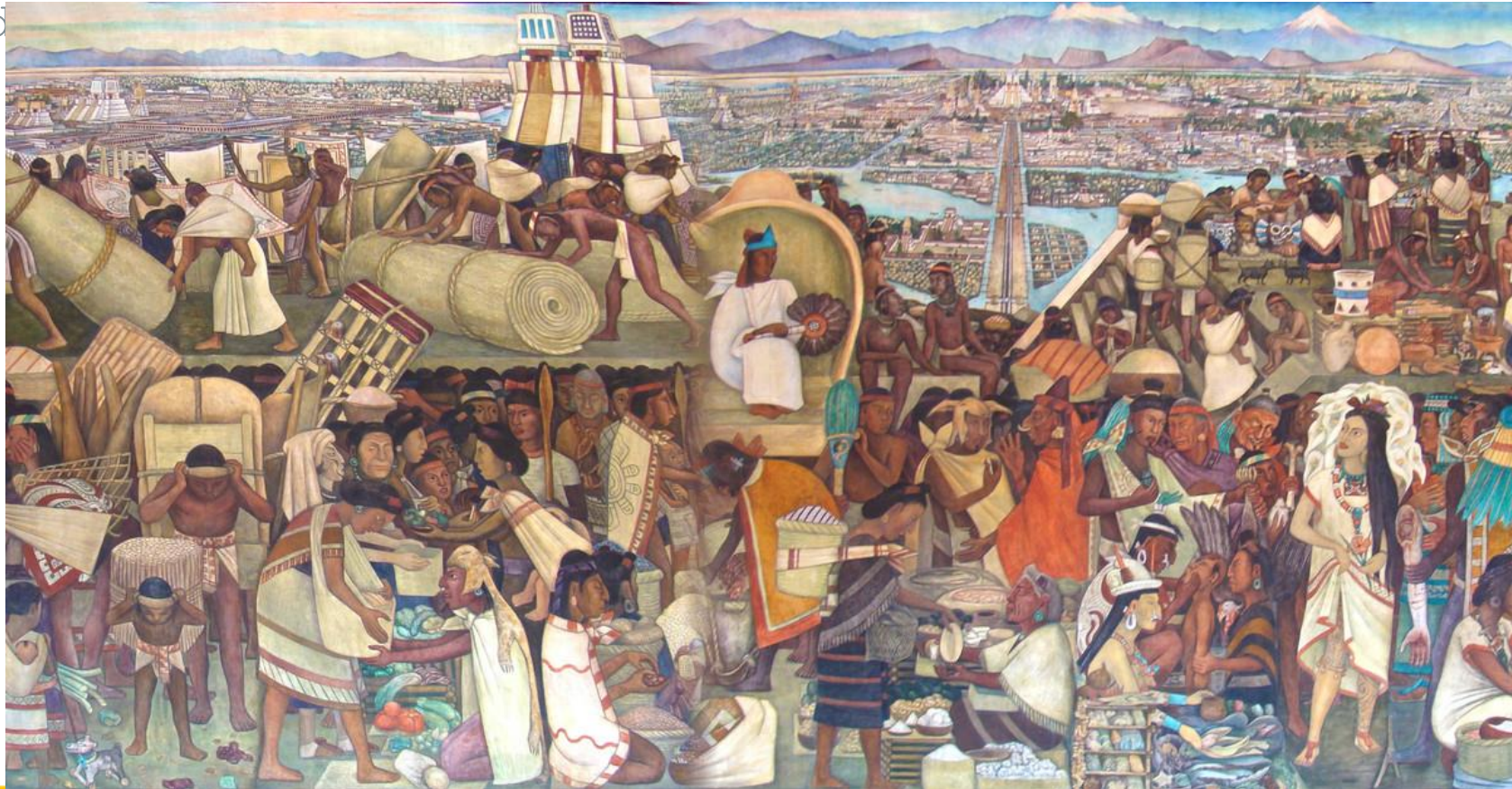
Rivera, Diego. (1945). El tianguis de Tlatelolco [Mural]. México: Palacio Nacional.