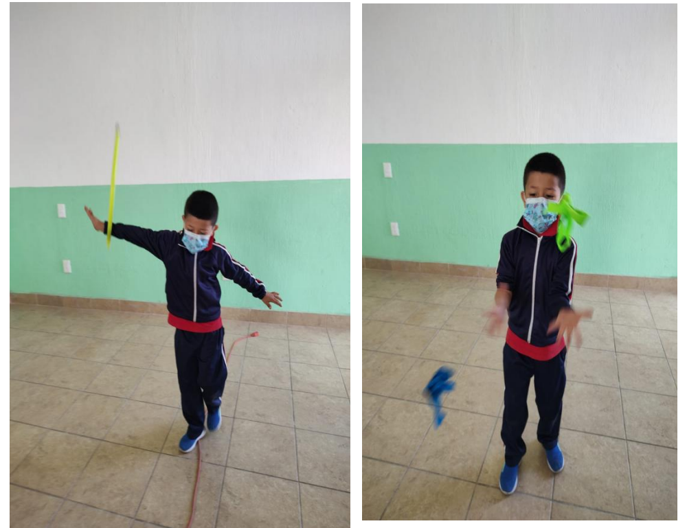
Fotografía 7 - 8 . Nota: Acto circense. Manzo P..2022

Reconocerás y demostraras el conocimiento que tienes de ti mismo, al poner prueba tus posibilidades motrices y expresivas al realizar un acto circense y compartirlo con tu familia.