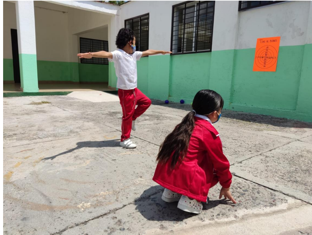
Fotografía 11. Nota: Estatuas 2 . Hidalgo P. 2022