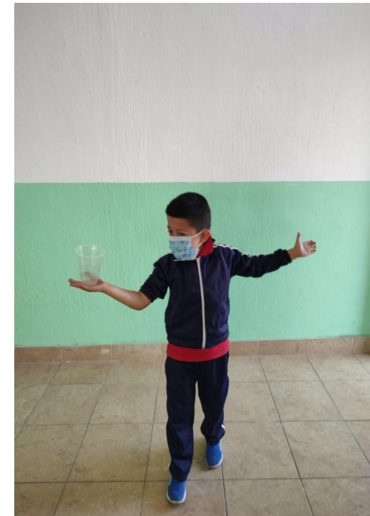
Fotografía 9 - 10 . Nota: Equilibrio. Manzo P. 2022