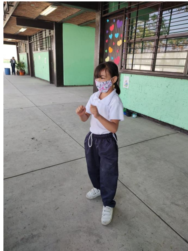
Fotografía 3. Nota: Preparación. Manzo P. 2022