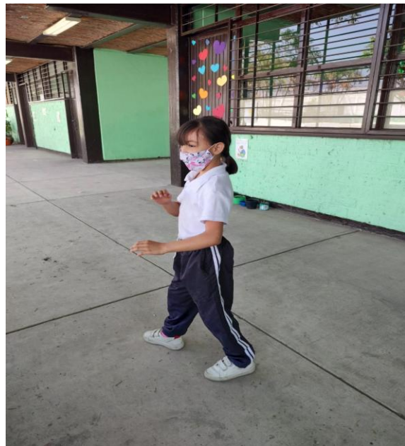
Fotografía 3. Nota: Estatuas . Hidalgo P. 2022

Material: Una tapita de garrafón , papel de baño, o un peluche.