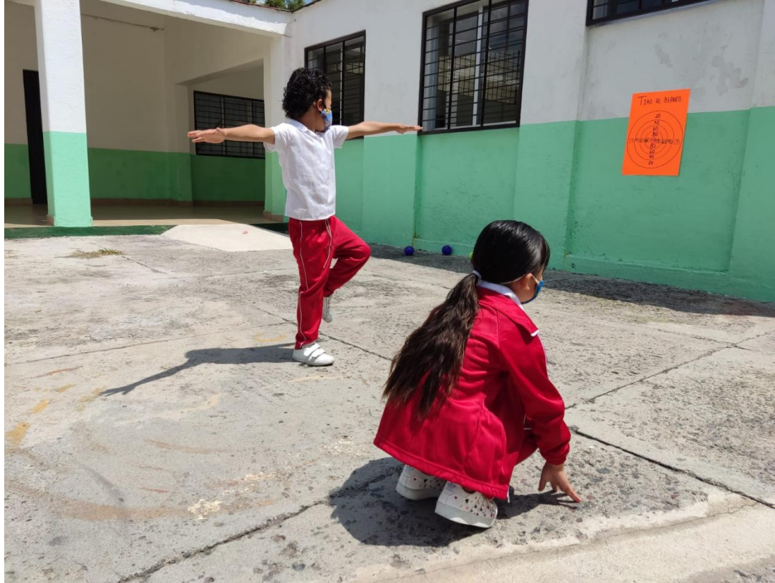
Fotografía 7. Nota: Estatuas 2 . Hidalgo P. 2022