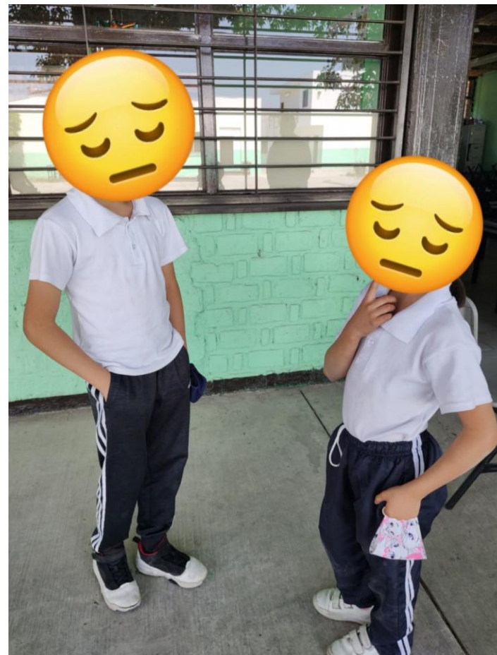
Fotografía 6 . Nota: Cuadro quemado . Manzo P. 2022