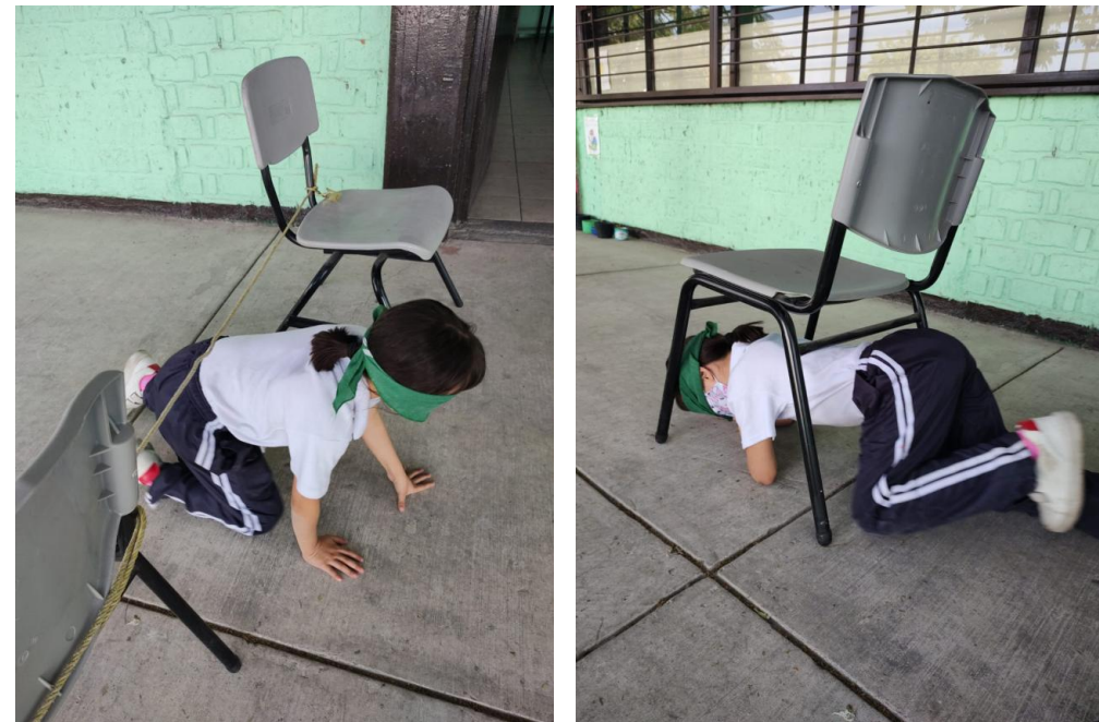
Fotografía 4 y 5. Nota: Terreno de aventuras . Cueva J. 2022