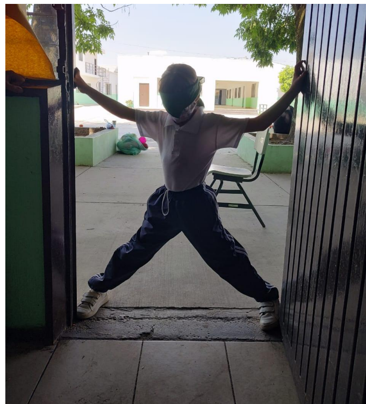
Fotografía 2. Nota: Postura puesta. Dávila M. 2022