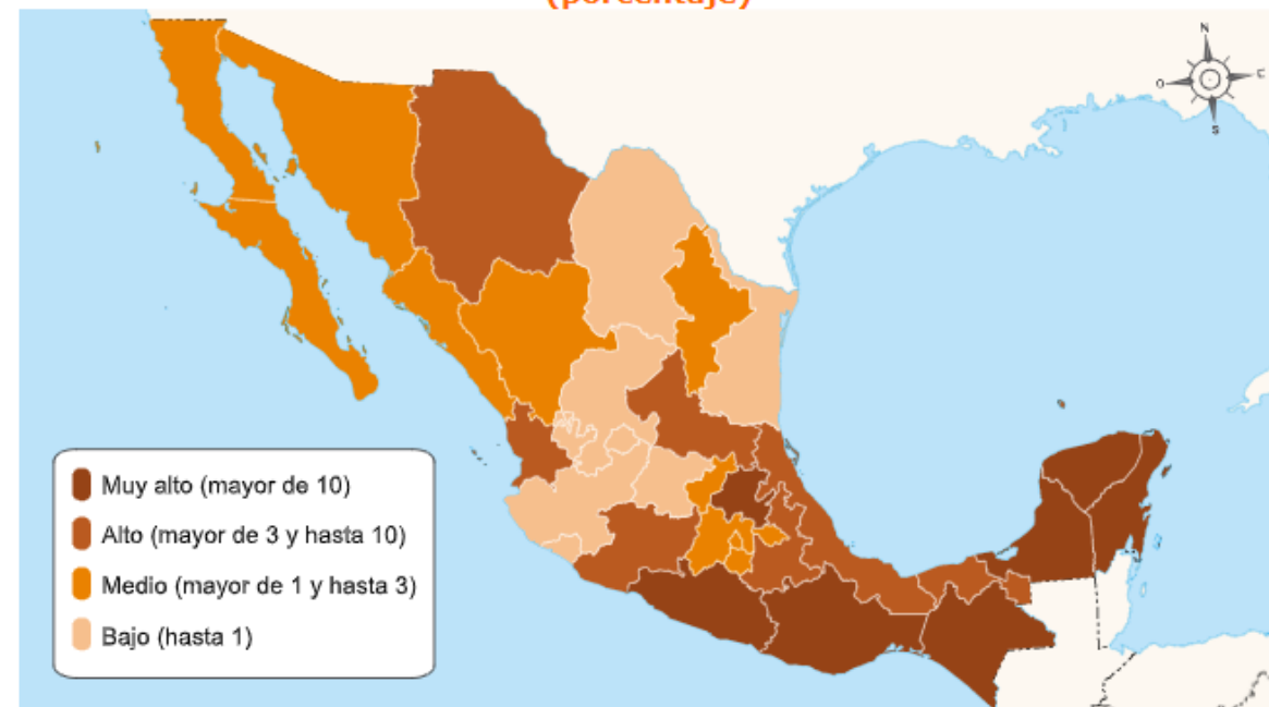
Población de 3 años y más hablante de lengua indígena 2020 (porcentaje)